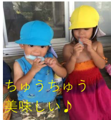
ちゅうちゅう 美味い♪