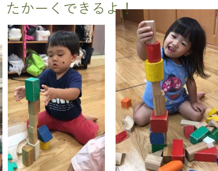
たかーくできるよ！