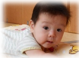
僕もなかまにいれてよ~