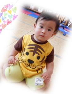
私たち、仲良し誕生日も一緒よ♡