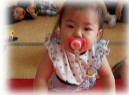
私も~なかまにいれてよ~