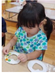
おはじきを埋め込みました♪