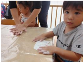
粘土を平らに広げて..