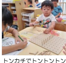
トンカチでトントントン