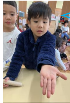
しろいおこめがでて きたよー！はやく たべたいな🍚