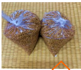
2斤袋二袋分の粳殻が 取れました🌱