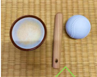
すり鉢とすりこぎ棒 軟式ボールを使って 粳すりを行いました😊